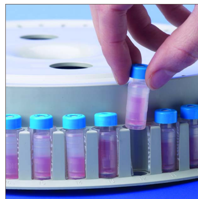
Mini-UniPrep avec les robots d'HPLC